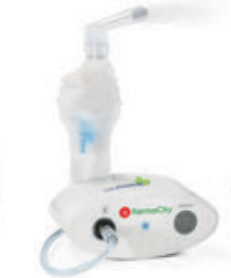
FARMACITY USB AEREOSOL