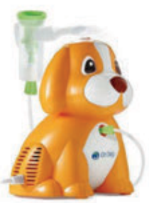
JB DR DOG AEREOSOL PED CAGN ORA