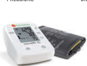
FARMACITY MISURATORE PRESSIONE