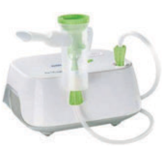
COLPHARMA AIR 50 CARE AEREOSOL