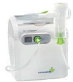
COLPHARMA AIR 10 THERAP C/DOC