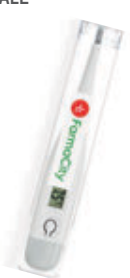
FARMACITY TERMOMETRO DIGITALE